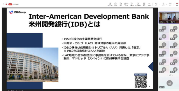
(IDB アジア事務所 芹生所長)